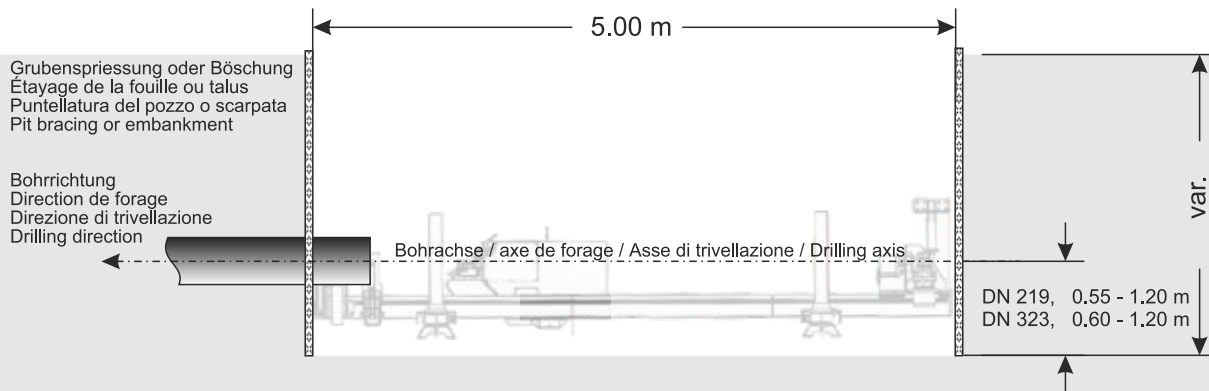
Schnitt / Coupe verticale / Proiezione verticale / Side view

Alle Masse sind Minimalmasse! Toutes les dimensions sont des dimensions minimales! Tutte le dimensioni sono dimensioni minime! All dimensions are minimum dimensions!