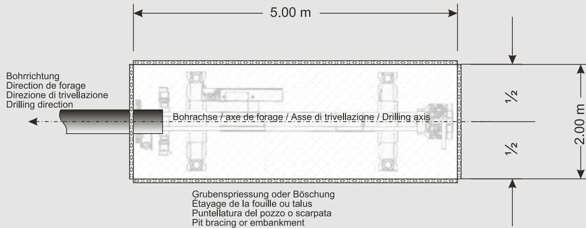
Grundriss / Coupe horizontale / Proiezione orizzontale / Top view