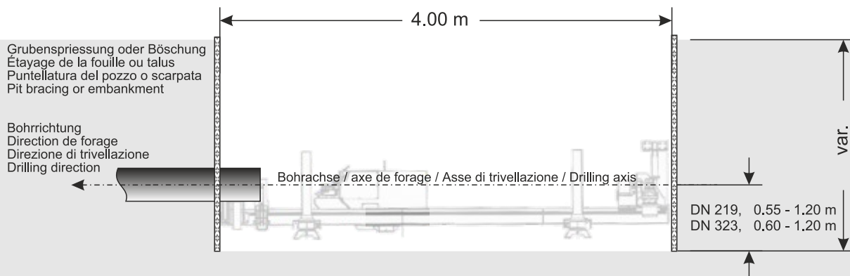
Schnitt / Coupe verticale / Proiezione verticale / Side view

Alle Masse sind Minimalmasse! Toutes les dimensions sont des dimensions minimales! Tutte le dimensioni sono dimensioni minime! All dimensions are minimum dimensions!