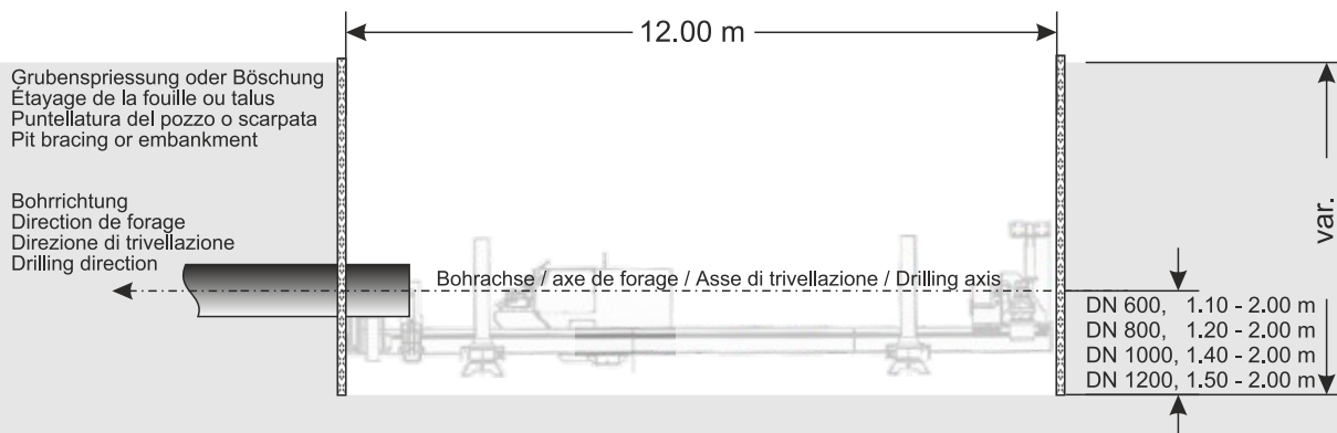
Schnitt / Coupe verticale / Proiezione verticale / Side view

Alle Masse sind Minimalmasse! Toutes les dimensions sont des dimensions minimales! Tutte le dimensioni sono dimensioni minime! All dimensions are minimum dimensions!